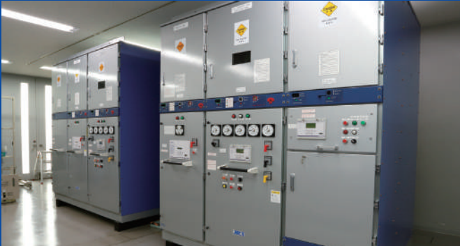
高圧配電盤シミュレータ