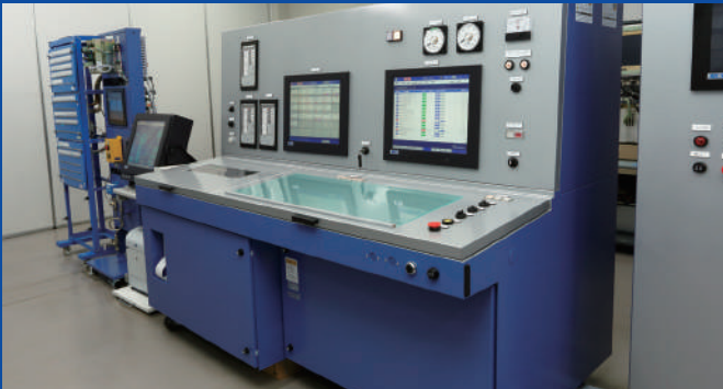
機関監視盤、アラーム・モニタリングシステムシミュレータ