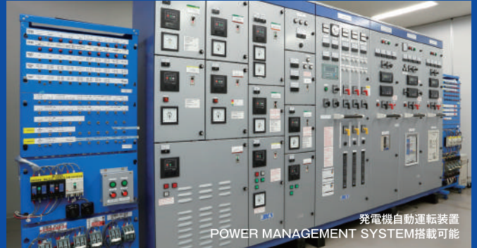
低圧配電盤シミュレータ